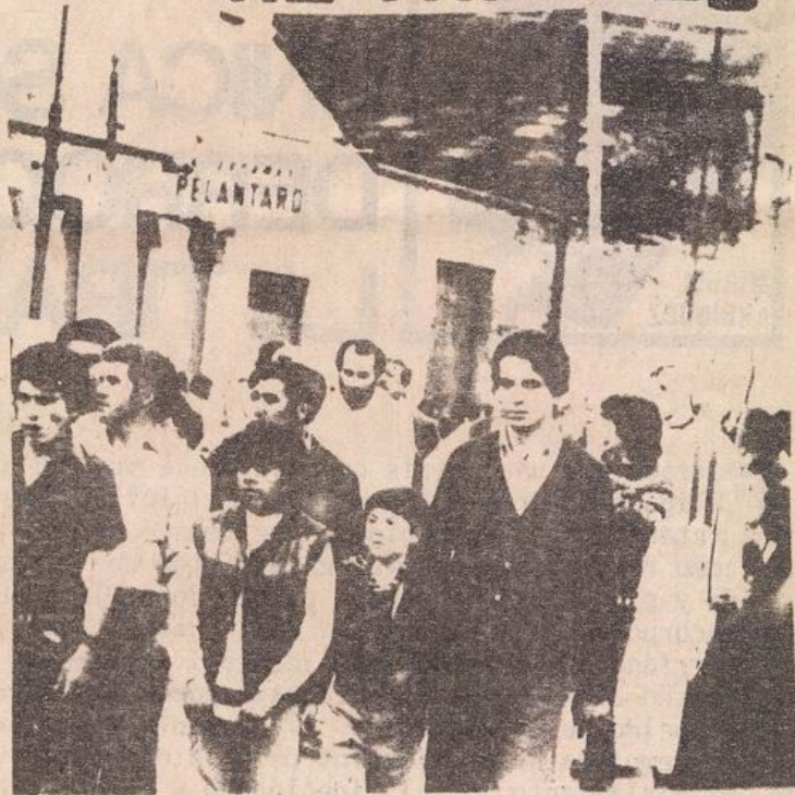
MARCHA DEL HAMBRE en la Comuna de Pudahuel.