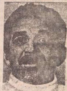
Gabriel García Márquez.

Así es el Premio Nobel de Literatura 1982. Enemigo de las dictaduras y motivo de odio y envidia de las babosas pseudointelectuales del régimen que, como Enrique Lafourcade, son "moluscos vermiformes, sin concha, que se arrastran por las huertas" de América Latina.